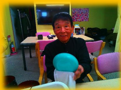
【綺麗な装飾、感動です】