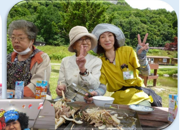
★八剣山ジギスカン ★クリスマス会