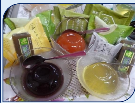
冷たいデザートで♡