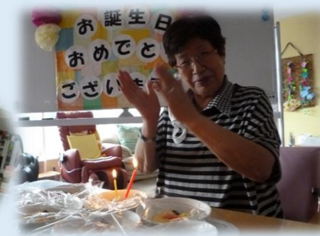
★お誕生日 おめでとうございます★