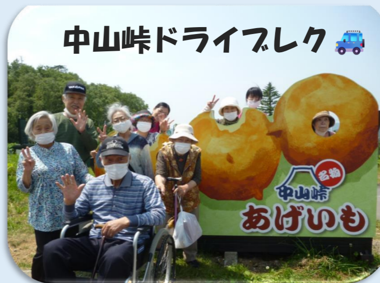
中山峠ドライブレク