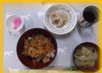
★ 豚キムチ丼 ★