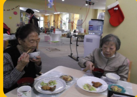
みんなで食べると美味しいです♪